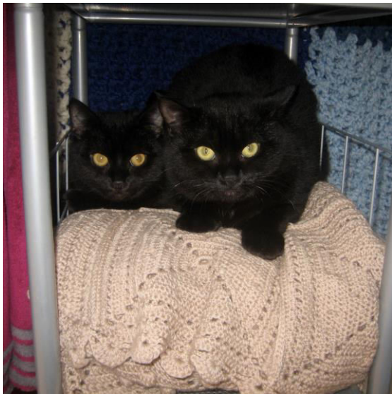
Les frères Nougat et Noiraud