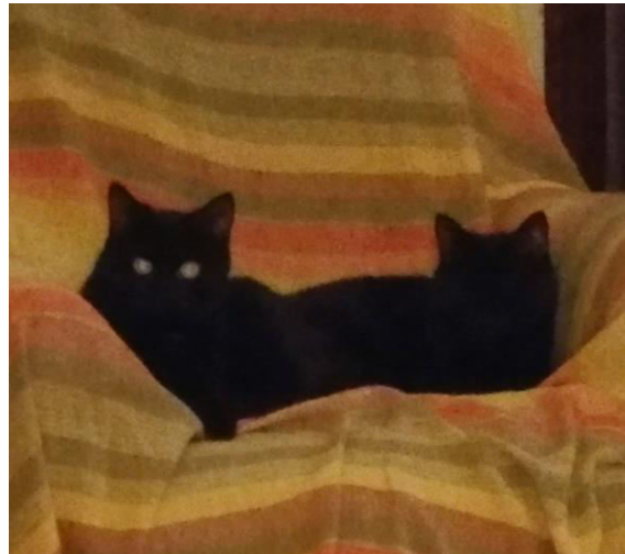
Frère et sœur Mowgli et Bagheera

Un petit pense-bête – Don Action pour le refuge Trohonan à Plouhinec le 21 novembre. Si vous en pensaient mais pas encore donnaient des choses ou faisaient un don chèque, la dernière possibilité sera le weekend 18-19 novembre. Si c'est déjà fait....merci!